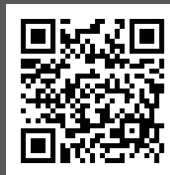
お申込み用フォーム

Email : MTS 事務局 <info@mansion-support.jp>