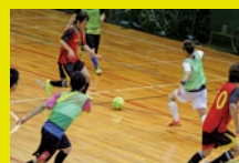
基礎体力づくりプログラム