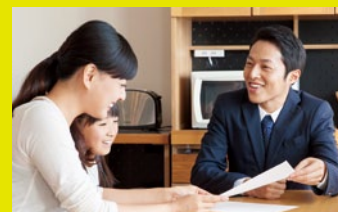
●訪問通学サポート