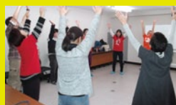
コミュニケーションプログラム (SSTからレクリエーション等)