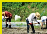
社会体験プログラム