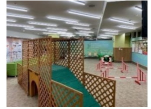
↑JOKER 店内はドッグラン併設