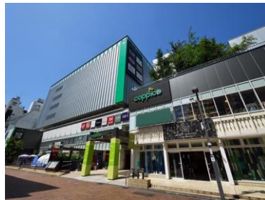
[コピス吉祥寺外観]