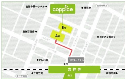
[コピス吉祥寺アクセス MAP]