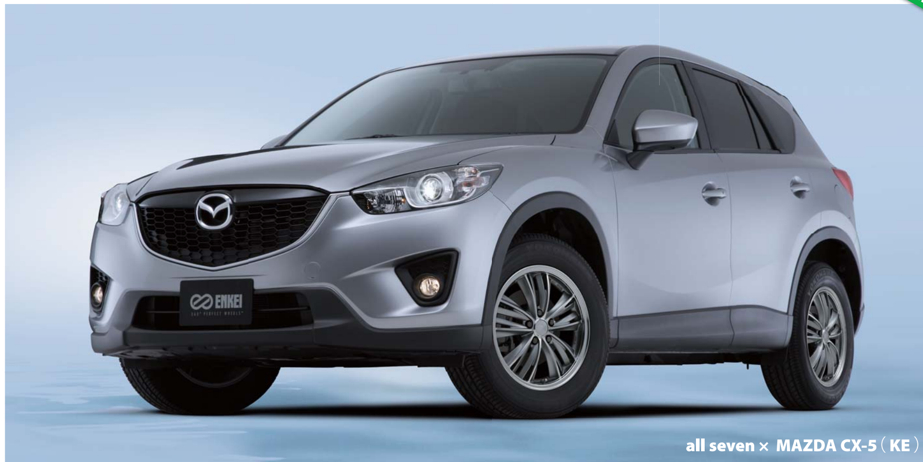
all seven × MAZDA CX-5 ( KE )