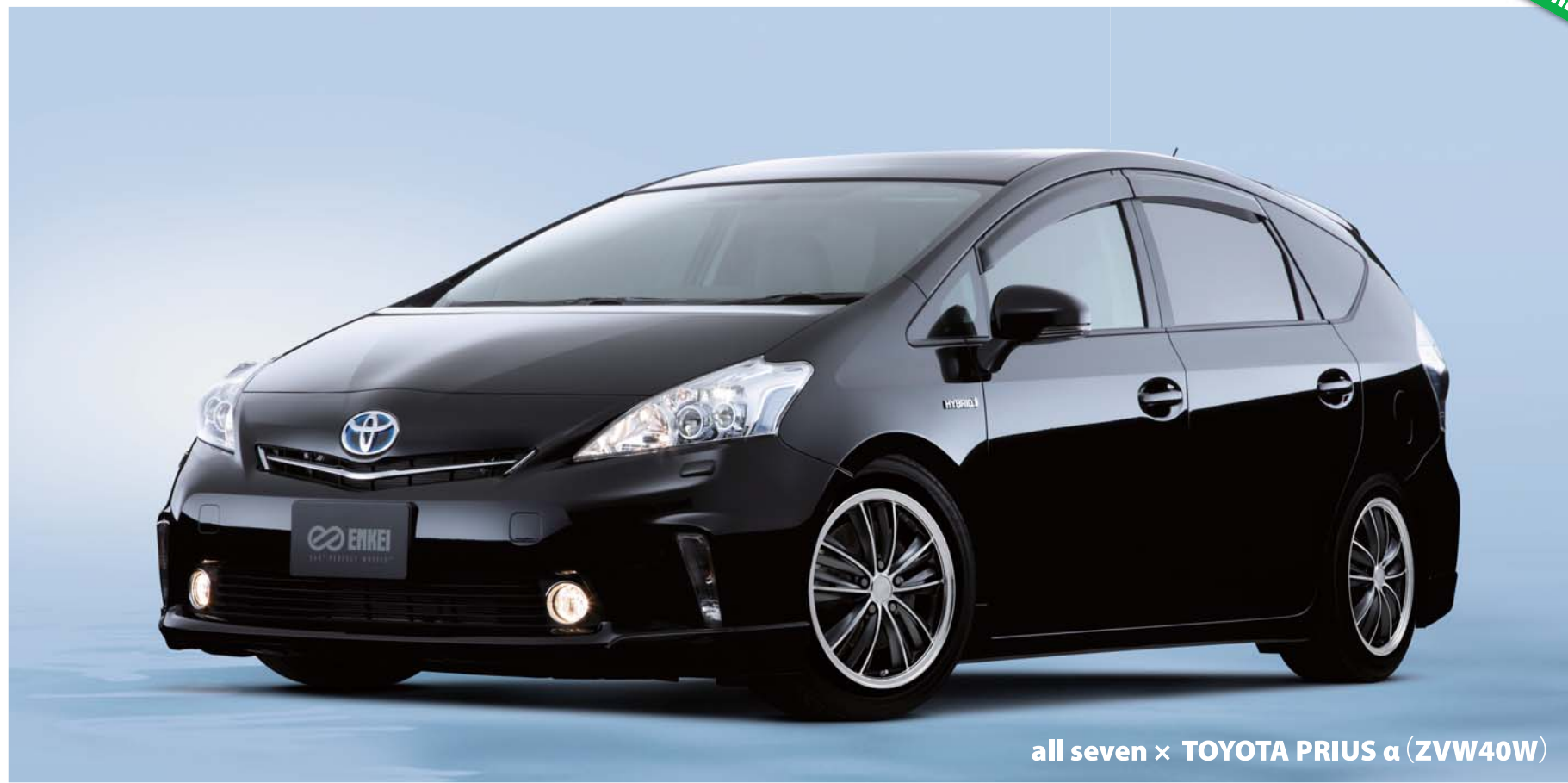
all seven × TOYOTA PRIUS α (ZVW40W)

Green = 「all」 Fashion + Green = 「all」 Fashion + Green = 「all」 Fashion +