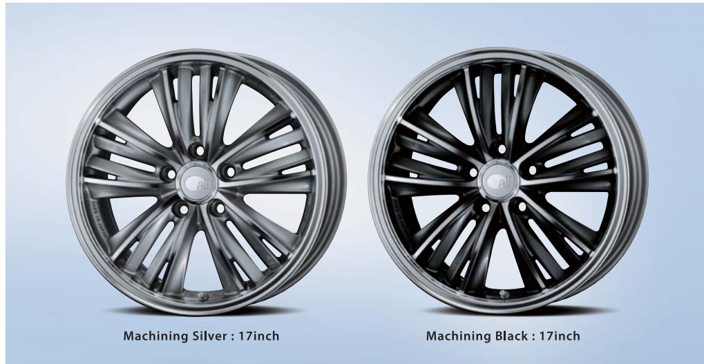
Machining Silver : 17inch

all seven + Green = 「all」 Fashion + Green = 「all」 all seven + Green = 「all」 Fashion + Green = 「all」