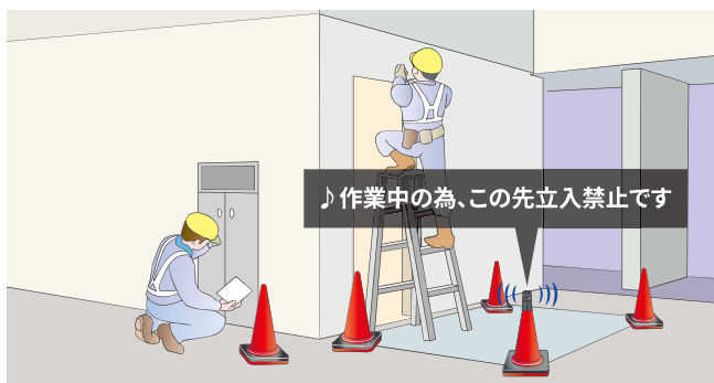
作業現場の注意喚起(オプションのコーンアタッチメントを使用)