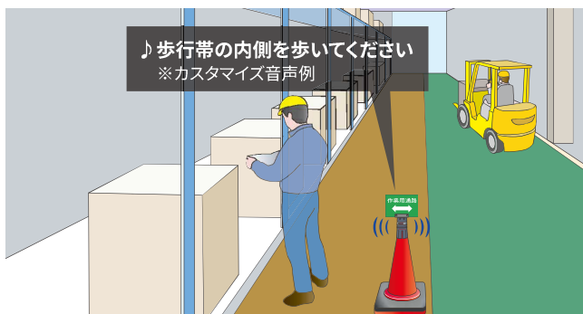
人車分離の安全対策(オプションのコーンアタッチメントとサインPOPを使用)