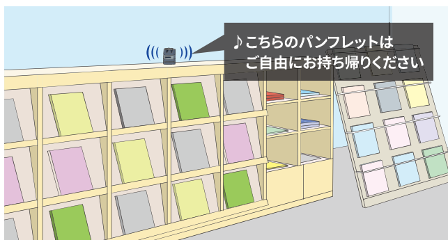
カタログ置き場のメッセージ