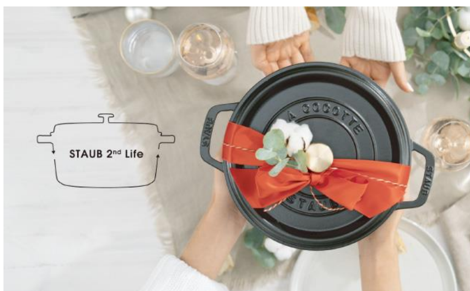
「STAUB 2nd Life Reward Program」メインイメージ