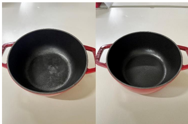
中面：クリーニング前（写真左）とクリーニング後（写真右）

中面の汚れは天然成分で安心なお酢や重曹を使い、丁寧に手入れを施します。クリーニング後の写真はオイルをなじませる仕上げ前の状態です。