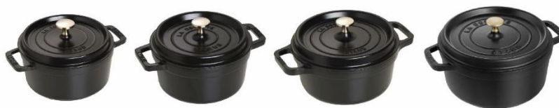
(左から) ピコ・ココット ラウンド 18cm/20cm/22cm/24cm

ピコ・ココット ラウンド 18cm/20cm/22cm/24cm (カラーは問いません)