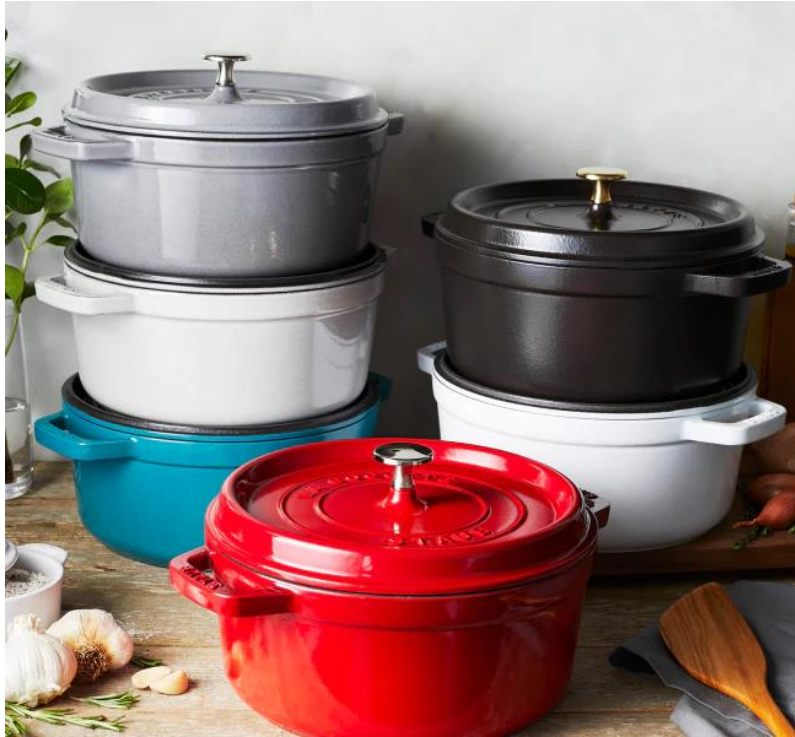
ピコ・ココット ラウンド イメージ