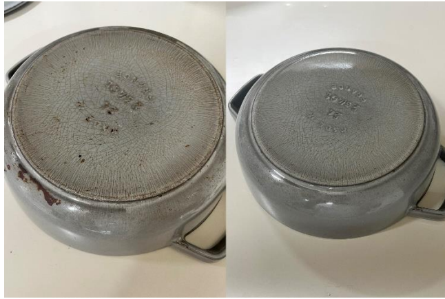
外面：クリーニング前（写真左）とクリーニング後（写真右）