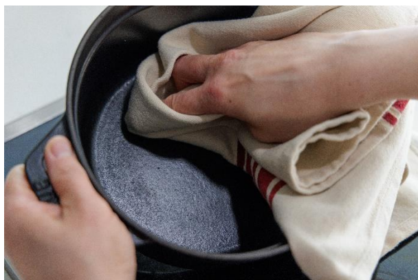
クリーニングの様子

生活に寄り添ってきたストウブに残るその汚れは、積み重ねた時間と思い出の痕跡。本プロジェクトでは、ブランドのポリシーおよびクオリティースタンドardsに基づき全体をクリーニングしています。はじめてのオーナーとの思い出はそのままに、身支度を整え、次なるあなたの食卓へストウブを運ぶサポートをします。