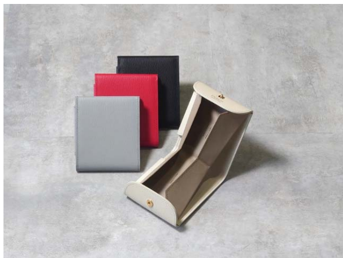
ハンモックウォレット piqué (意匠登録済)