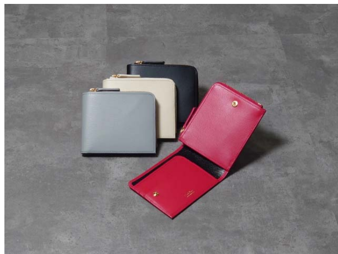
ジャミーウォレットプラス piqué (意匠登録済)