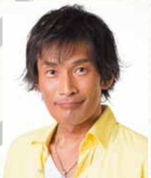
【数字大臣】杉田あきひろ