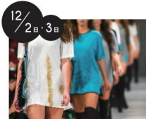
関西コレクションエンターテインメント京都河原町校 -X'mas RUNWAY SHOW-