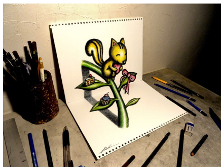
《バレンタインデー》2019年