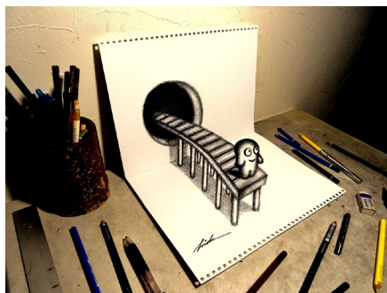
《穴から飛び出した橋》2021年