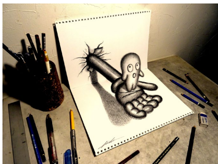
《飛び出した小人》2020年