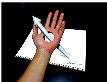
《手のひらを貫通する矢印No.1》2019年