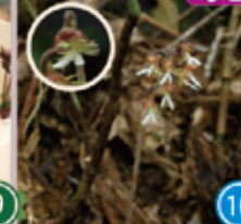
・特別展 - 沖縄に生きる野生ラン