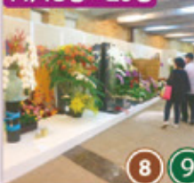
・フラワーデザイン展示