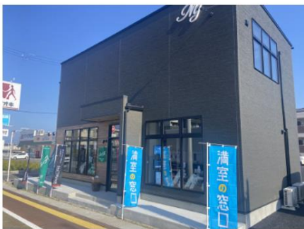
テナント・事務所