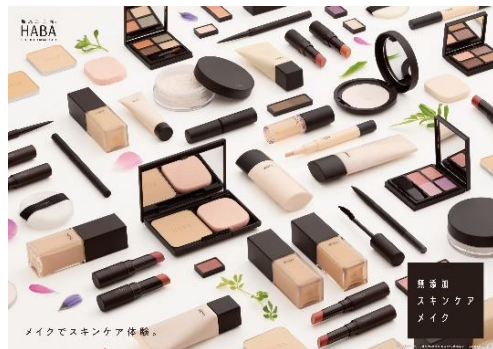
2024年1月22日(月)リニューアル発売の無添加スキンケアメイク

■会場: ザ スtrings 表参道 地下1F イーストスイート(東京都港区北青山3-6-8)