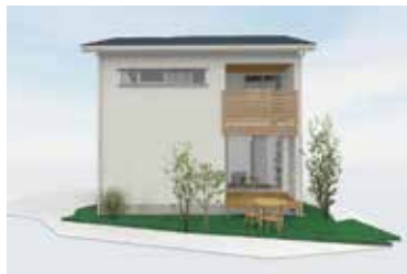
モデルハウス外観イメージパース

京都のモデルハウスは延床面積 105.17 m 2 、31.81 坪のリアルサイズの二階建て。暮らしの煩雑さ、お困りごとを標準仕様・手の届く価格で解決する、泉北ホームの家づくりのコンセプトをご体感いただけます。