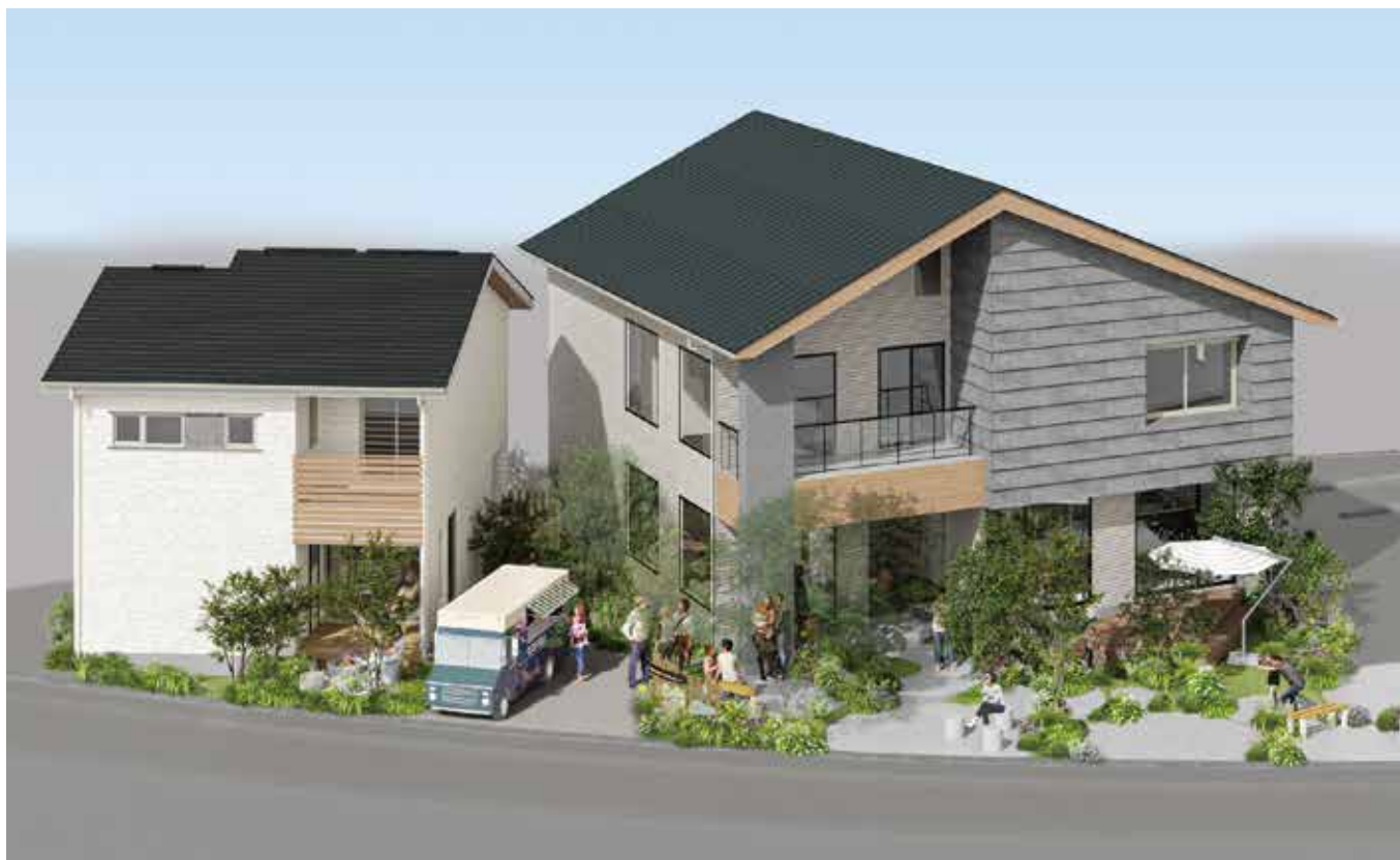
ショールーム京都伏見 イメージパース

泉北ホーム、関西 16 店舗目となる大型ショールーム & モデルハウスが 京都市伏見区六地蔵に 2023 年 11 月 3 日 (金・祝) グランドオープンいたします。