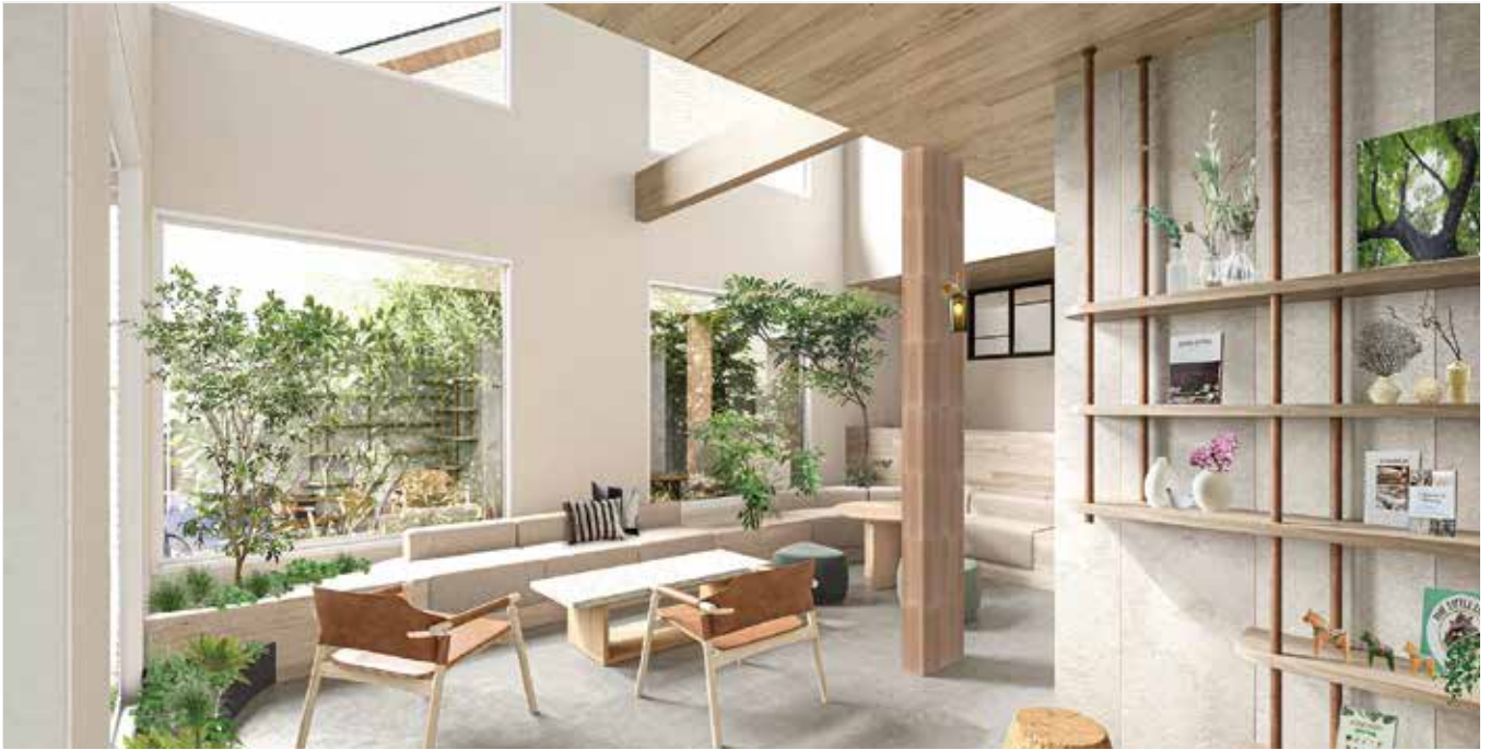
エントランスイメージパース