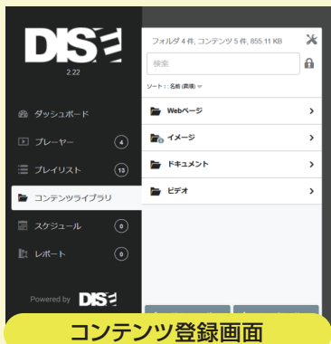
コンテンツ登録画面