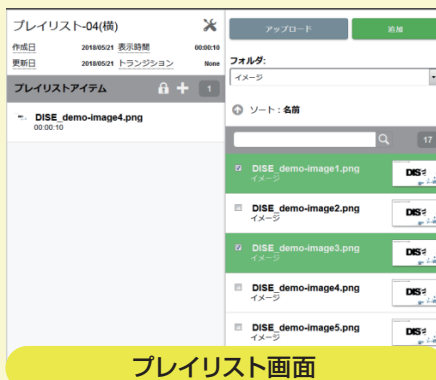
プレイリスト画面