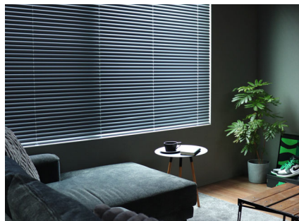
お名前：ちる さま 商品名：ベネシャンブラインド 「セレーノグランツ」