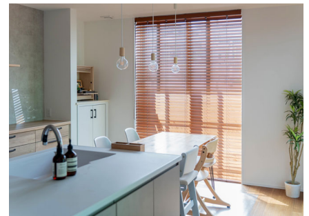
お名前：ひまかいまま さま 商品名：ウッドブラインド「クレール」