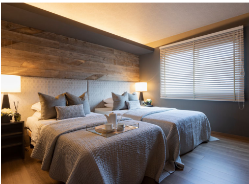
お名前：デザイン アンテリユ テラダ ユミ さま 商品名：スタイルブラインド「クオラ」

築20年の家にブラインドが新たな息吹をもたらした様子を感じました。年月を経過した床や梁、窓枠、そして家具達が透け感のある「もなみ」の表情でさらに味わい深さを醸し出しているようです。大窓から見える緑豊かな景色は、ツインスタイルのスクリーンを通して見ると奥行きも感じられます。 スクリーンの高さを調整して朝の光を眺めたり、夜は落ち着いた雰囲気を楽しんだり、様々な演出が想像できる魅力的な空間として評価しました。(丸茂みゆき)