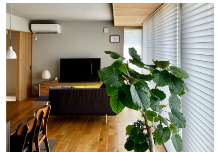
お名前：ツリ さま 商品名：調光ロールスクリーン「ハナリ」