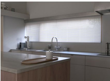
お名前：eno さま 商品名：ベネシャンブラインド 「セレーノグランツ」