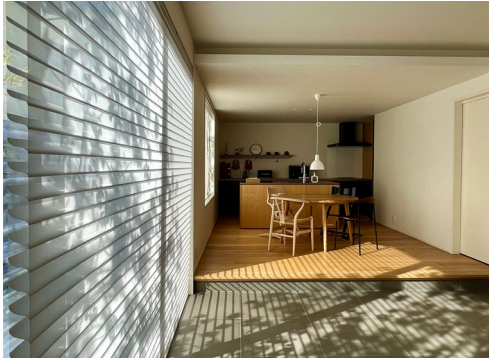
お名前：s.h.l____2.1 さま 商品名：調光ロールスクリーン「ハナリ」