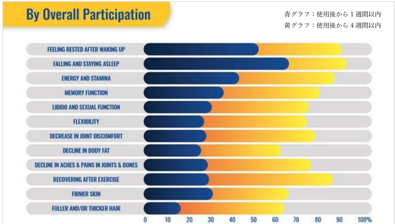
▲カテゴリー別にみる健康ニーズへの満足度の推移