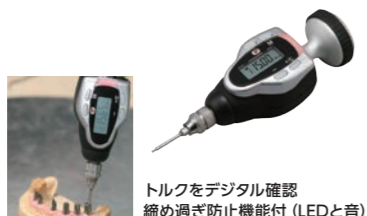
トルクをデジタル確認 締め過ぎ防止機能付 (LEDと音)