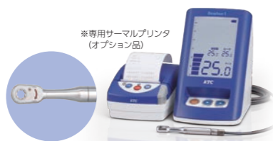
※専用サーマルプリンタ (オプション品)