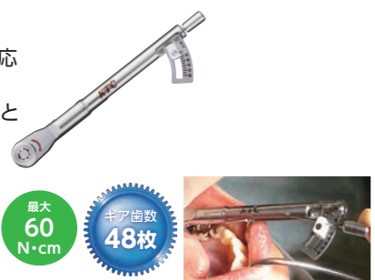
最大 60 N・cm ギア歯数 48枚