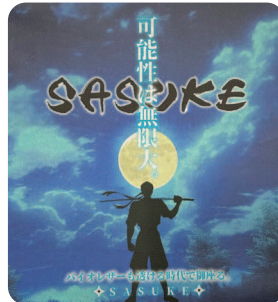
バックライト点灯時