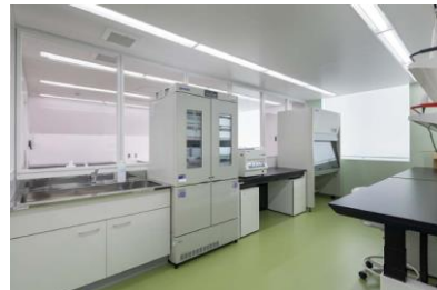
所沢lab 遺伝子検査エリア