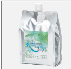
除菌殺菌システム