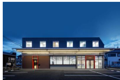
所沢lab 衛生検査所の全景

今後さらに遺伝子検査分野の強化を図りながら、これまでヘルスケア事業で培った経験を検査領域で活かし、医療分野に貢献してまいります。