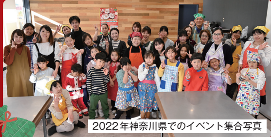
2022年神奈川県でのイベント集合写真

皆さんこんにちは！横浜からやってきました、巻き寿司教室ぐるりです。11/3（金祝）に東和町で「サンタクロース」の絵巻き寿司を実習するイベントを開催します。小学生以上のお子様ならどなたでも受講できますので、ぜひご参加ください。