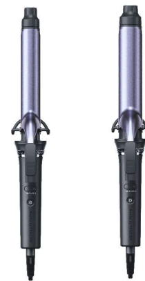
NIM326A 26mm径 -K(ブラック)