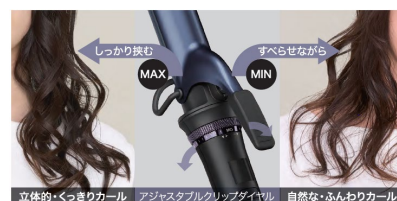
アジャスタブルクリップ