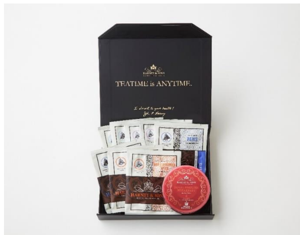
【HARNEY & SONS 京都タカシマヤ店 オープン限定セット】

HARNEY & SONS のシグネチャーブレンド Hot Cinnamon Spice (ホット・シナモン・スパイス)や Paris(パリ)を始め、紅茶、白茶、緑茶、ウーロン茶、ハーバル茶などバラエティー豊かなラインナップの茶葉をルースタイプ・サシェタイプをご用意しております。また、サスティナブルな観点から注目されるバルクスタイル(各茶葉を量り売り 30g よりお求めいただけます。)は関西発の実施店舗となります。HARNEY & SONS を初めてお求めの方にもお選びいただきやすい人気の高いフレーバーを集めた、お得なセットをご用意いたしました。