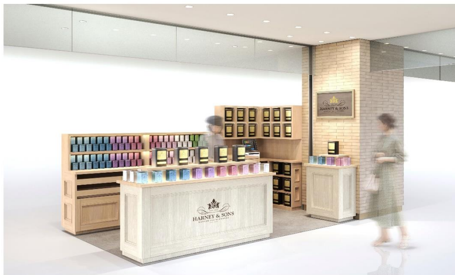
HARNEY & SONS 京都タカシマヤ店 新店舗イメージ図

「千年の都」と称えられる京都の街並みに馴染むようなナチュラルさと HARNEY & SONS NY・ミラートン本店の伝統的デザインを融合させた店舗デザインです。また、関西初となる量り売り実施店舗でもあります。