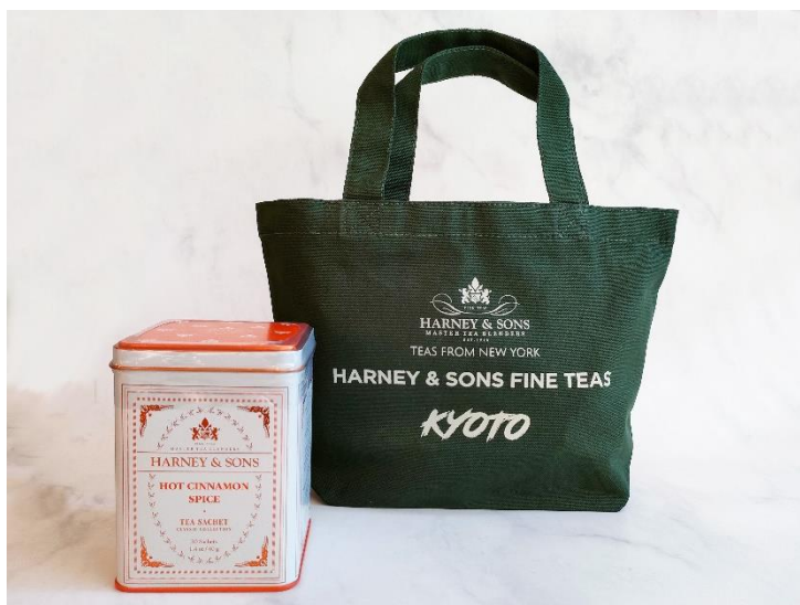
京都店タカシマヤ店オープン限定トートバッグ