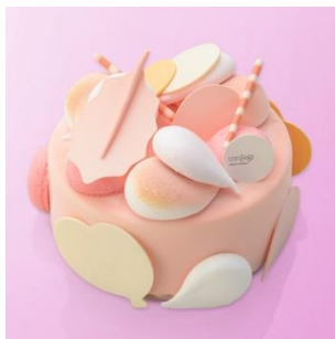
■コンフェクト コンセプト ShinQs 限定 Mabelle / 6,700 円 (直径 12cm × H5cm)