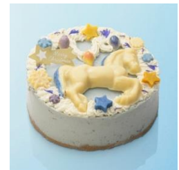
■Coco ChouChou (ココシュシュ) ヴィーガンローストロベリーケーキ / 4,980 円 NET 限定 たっぷりのいちごを加えたカシューナッツとココナッツオイルで出来た滑らかでクリーミーなローケーキ。ローとはRAW（生）という意味で、48度以上に加熱しないことで栄養を損なわないところが特長です。ラズベリー、ブラックベリー、ブルーベリー、赤すぐりなど様々なベリーが盛りだくさんです。（直径 12cm）