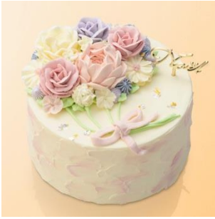
■nico design house ShinQs 限定 (ニコデザインハウス) nico balloon / 6,900 円 (直径 12cm × H7.5cm) ※配送(冷凍)のみの承りとなります ※価格は送料込みです