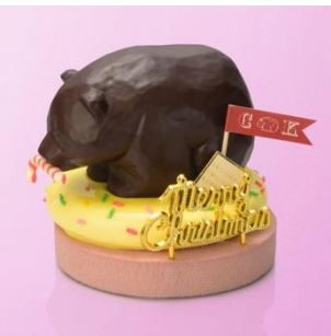
■SMILELABO ShinQs 限定 (スマイルラボ) シルク・ドゥ・キボリーヌ / 6,048 円 (直径 12cm × D13cm × H12cm)