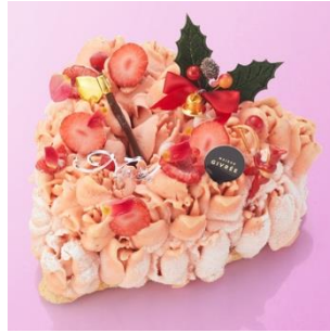
■メゾンジブレー ShinQs 限定 クリスマスハートロッソ / 6,480 円 (W18cm) ※配送(冷凍)のみの承りとなります ※価格は送料込みです