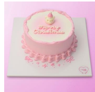
■yolumcake ShinQs 限定 (ヨルムケーキ) Pink♡Teddy Bear Christmas / 5,562 円 (直径 13cm)