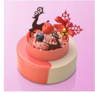
■和楽紅屋 ShinQs 限定 マツリカ / 4,201 円 (直径 12cm × H7cm)