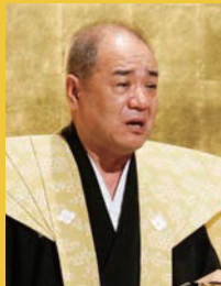
人形浄瑠璃文楽太夫 豊竹呂太夫氏