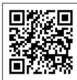
個人オーナープラン商品ページへ

※ 伊賀鉄道ホームページからは、トップページの「つり革オーナー募集」バナーから「いがてつオンラインショップ」の商品ページへリンクしています。