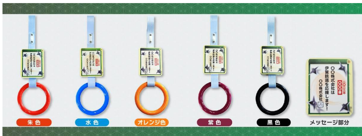
〔法人オーナー〕 たて 10.0 cm × よこ 8 cm メッセージは全角24文字（12文字×2行）