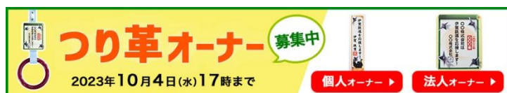
つり革オーナー募集バナー

※ 伊賀鉄道ホームページからは、トップページの「つり革オーナー募集」バナーから「いがてつオンラインショップ」の商品ページへリンクしています。