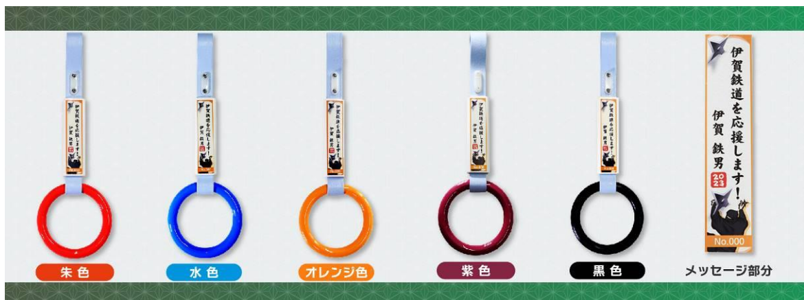
〔個人オーナー〕 たて 11.5 cm × よこ 2.5 cm メッセージは全角12文字（1行）