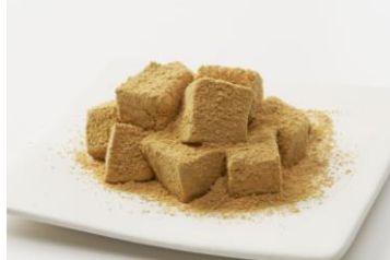
『料亭わらび餅』 (税込 604 円/1 パック<大>)