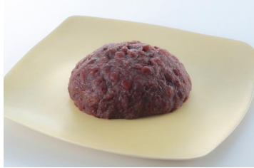
『おはぎ (つぶ)』 (税込 140 円/1 個)

看板商品として不動の人気を誇る『おはぎ (つぶ)』や「料亭 柿安」でもお出ししている『料亭わらび餅』は、長く愛されている「口福堂」の代表的な商品です。さらに季節ごとに期間限定商品が店頭を彩ります。マスカット、巨峰、和栗といった、秋の味覚を楽しめる『水まんじゅう』もご用意しております。おやつはもちろん、ちょっとした手土産にもご利用いただけます。