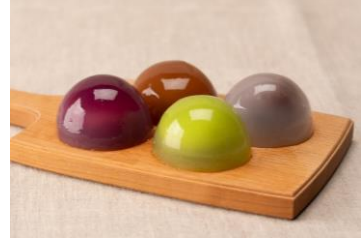
『水まんじゅう』 (税込 194 円/各 1 個)