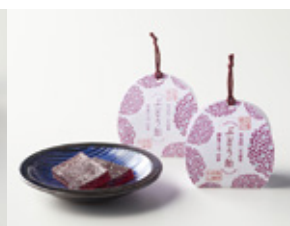
ぶどう飴 御菓子司 山善