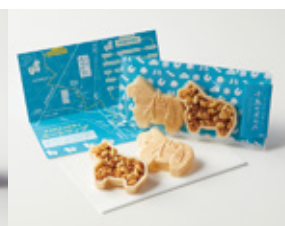
チャグチャグ馬ッコ子馬のポルカ 馬ッコ本舗みやざわ