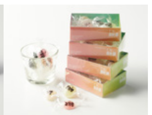
焼酎糖 関口屋菓子舗