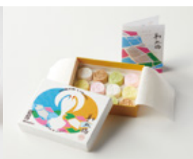
彩双鶴 双鶴本舗 丸基屋