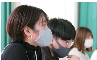
Re colab KOBE