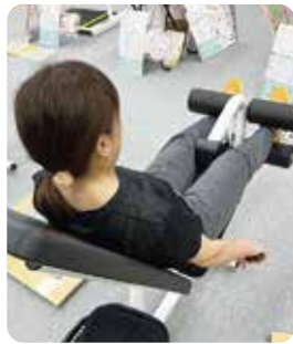
(週3回筋トレ 50代 Y様)

市販のサラダチキンは添加物が心配で、プロテインは味が苦手でした。添加物フリーの阿波食品さんの味付ささみは、多少パサつきは感じるものの風味豊かで味もよく、素材そのままの安心感があります。