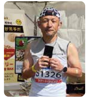
(市民ランナー 50代 M様)

阿波食品さんの国産ささみは、 常温で持ち運び ができます。いつでもバッグに入れておくと急に思い立ってトレーニングをしても、運動後すぐにたんぱく質を摂取することができるようになりました。