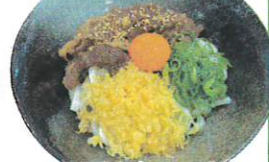
国産牛ぶっかけうどん

古都華いちごシロップをふんだんに使ったかき氷やソフトクリーム等のひんやりメニューの他に、大人気のローストビーフ丼や夏季限定の「大海老天ぶっかけうどん」、「国産牛ぶっかけうどん」も新登場!