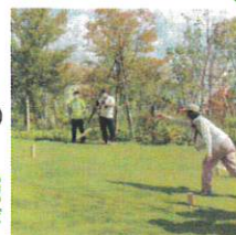
ニュースポーツ『クップ』