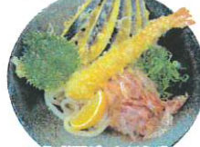
大海老天ぶっかけうどん