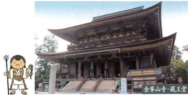
金峯山寺・蔵王堂

定期観光バスだけ!! 貸切特別拝観 金峯山寺では現在修復工事中の国宝・仁王門を特別に見学いただけます。