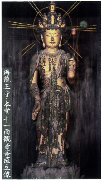
海龍王寺・本堂十一面観音菩薩立像