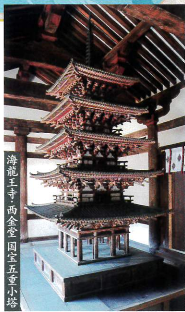
海龍王寺・西金堂・国宝五重小塔