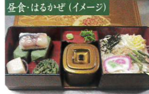
昼食・はるかぜ(イメージ)