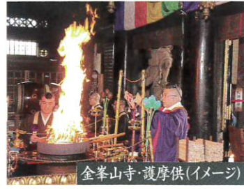
金峯山寺・護摩供(イメージ)