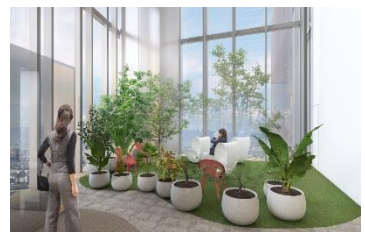
【リフレッシュゾーン】