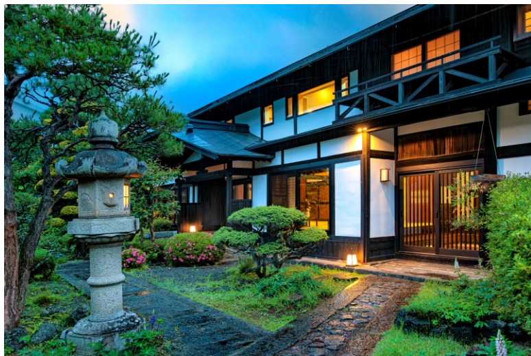
1819年建造 母屋（文化庁登録有形文化財）

世界各国のデザイナーに注目される宿泊施設となった岳麓翠苑は、1日1組限定の一棟貸し宿泊施設として2023年9月30日に開業いたします。