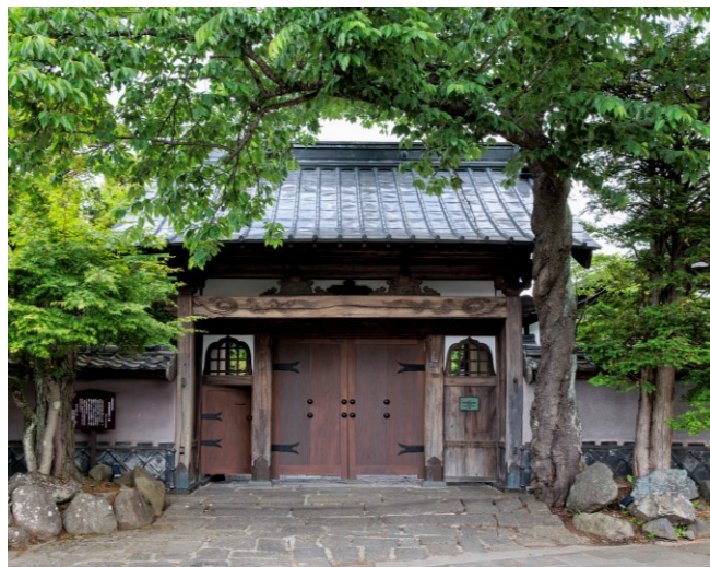
1818年移築 長屋門（富士河口湖町指定有形文化財）