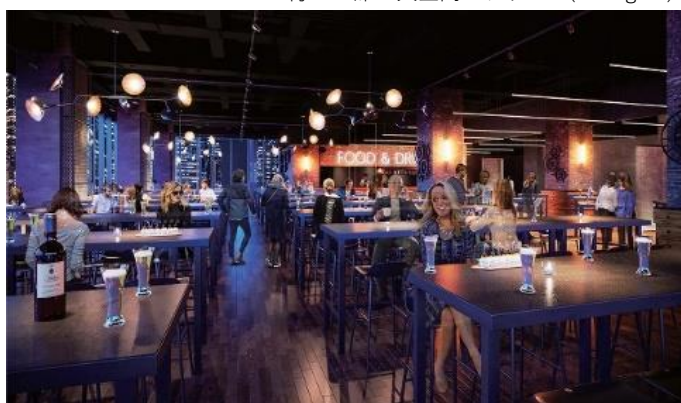
約 400 席の大空間のラウンジ(Lounge 5)

施設内外に6,200口のコインロッカーを備えます。荷物を持つ煩わしさから解放されることで、快適にライブ・コンサートをお楽しみいただけます。また、どの席からもアクセスがしやすいよう、売店を11箇所に配置します。すべての売店でキャッシュレス決済を導入し、待ち時間の軽減と利便性向上を実現します。