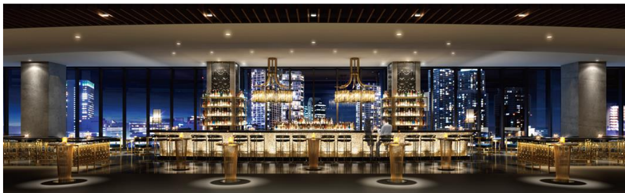
音楽と横浜の夜景を楽しめるバーラウンジ(Arena Bar 7)

横浜の美しい夜景の中で、ライブ・コンサートに思いを巡らせながら楽しめるバーラウンジ(Arena Bar 7)や、公演前後の興奮や余韻を分かち合いながら、ゆっくりと飲食を楽しめる約400席の大空間のラウンジ(Lounge 5)を設けています。また、アリーナ内でも音楽と飲食を同時に堪能できるよう、すべての座席にカップホルダー 2 個*を設置します。*一部座席を除く