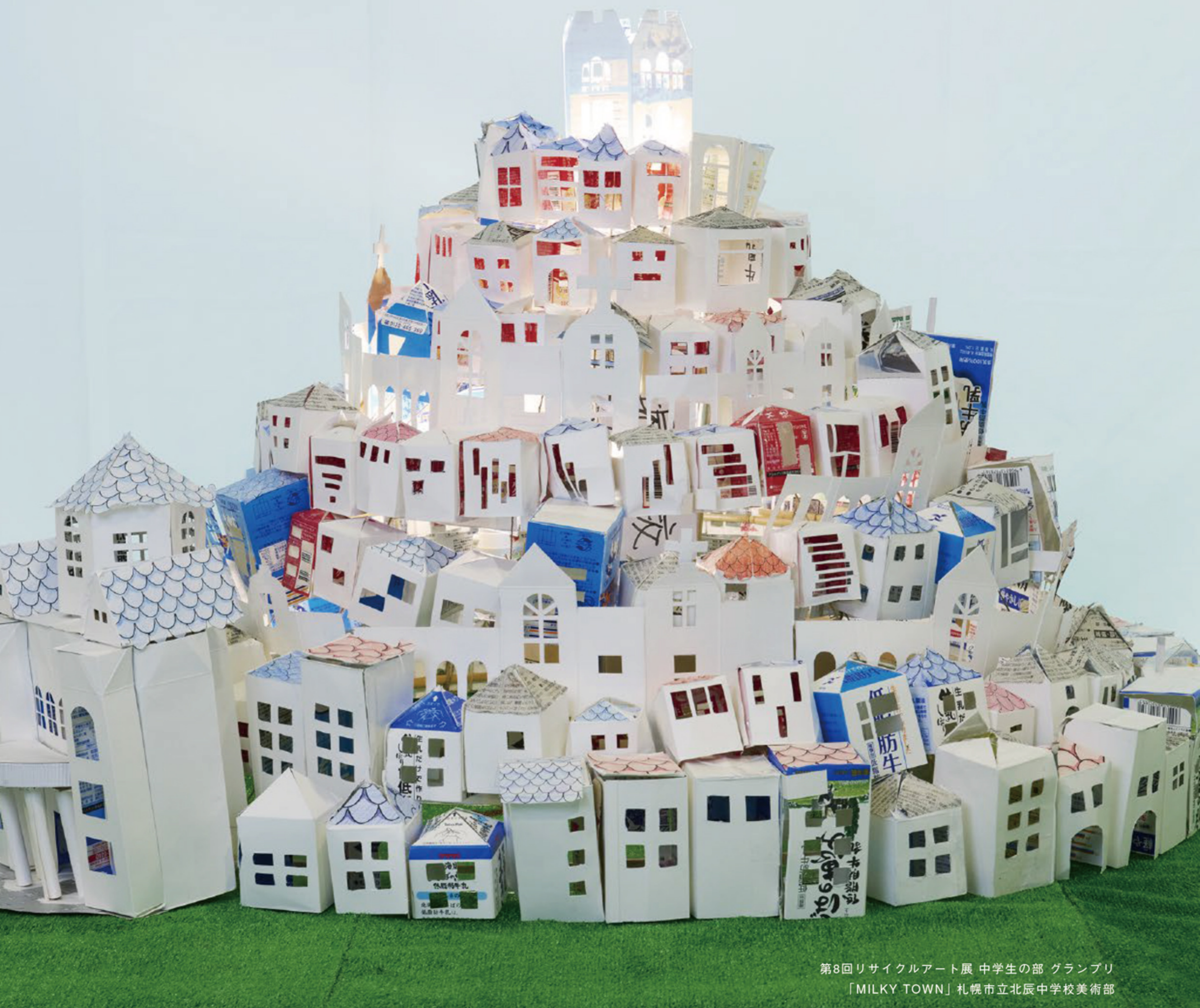
第8回リサイクルアート展 中学生の部 グランプリ 「MILKY TOWN」札幌市立北辰中学校美術部