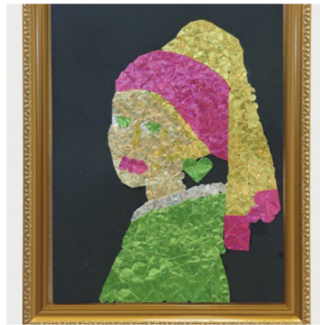
■ 高校生の部 グランプリ Beautiful/小林美陽