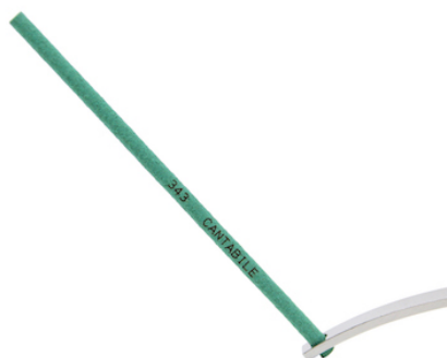
インセンス イメージ