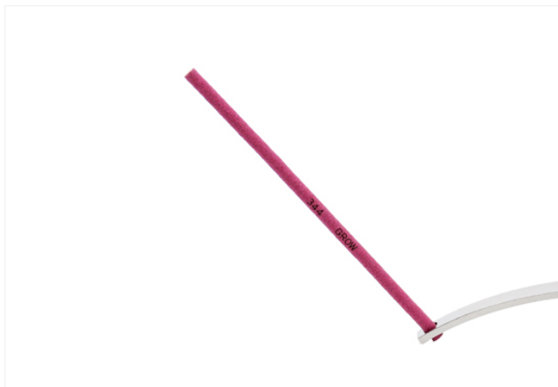
インセンス イメージ