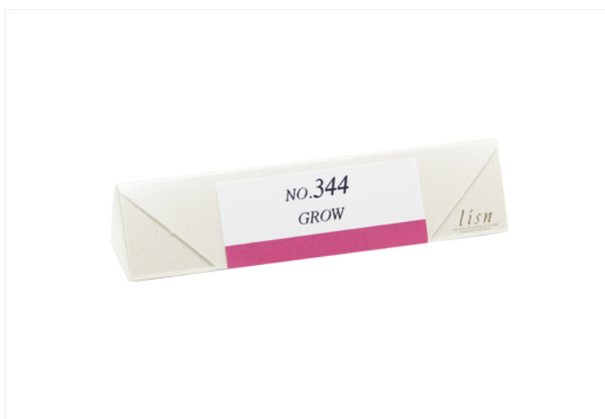
インセンス 10本入 パッケージ