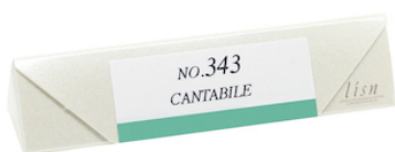
インセンス 10本入 パッケージ