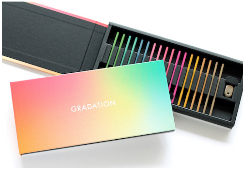
新商品 GRADATION ASSORTMENT