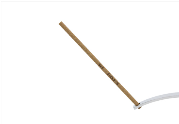
インセンス イメージ