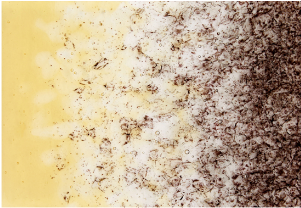
345 ENDLESS イメージビジュアル

URL : https://store.lisn.co.jp/shop/g/g850345/