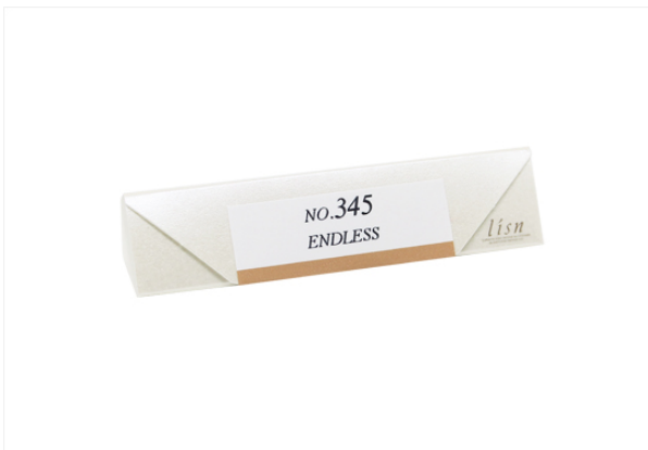
インセンス 10本入 パッケージ