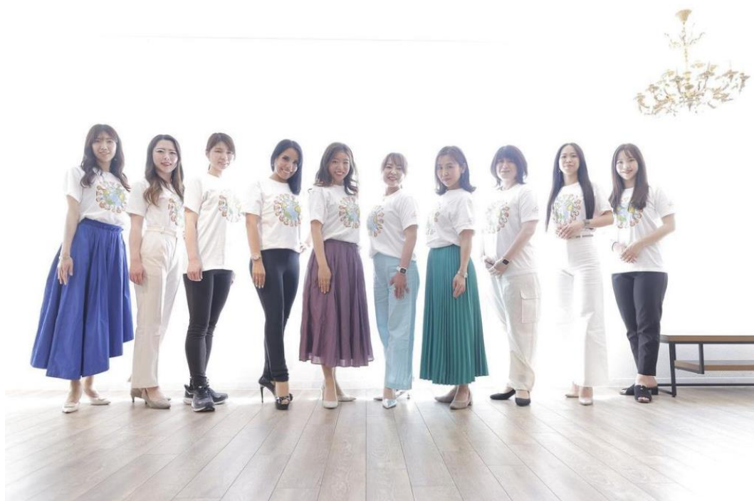
ミズエシカリンクジャパン 2023 愛知大会ファイナリスト (一部)