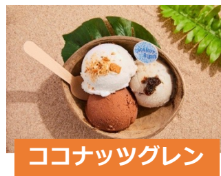
ココナッツグレン