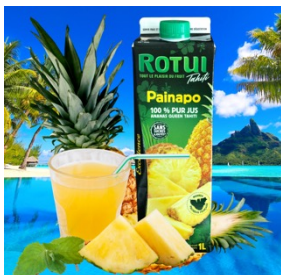
ROTUI100% パイナップルジュース