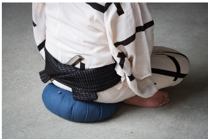
ZAFU1 尺サイズを使用した様子