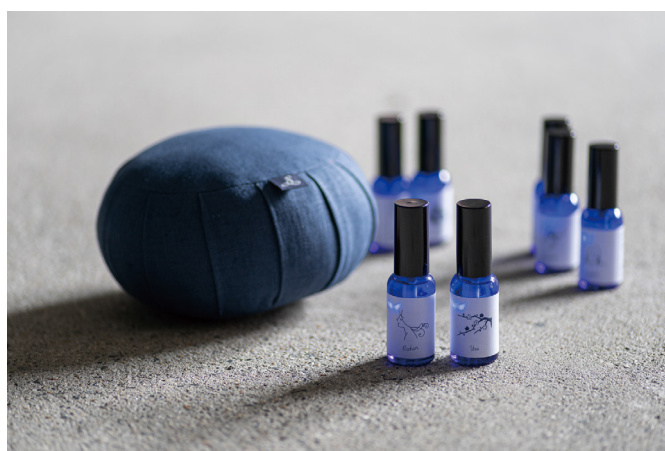
オリジナルで調合の瞑想用ルームフレグランス 24 節気メディテーションミスト