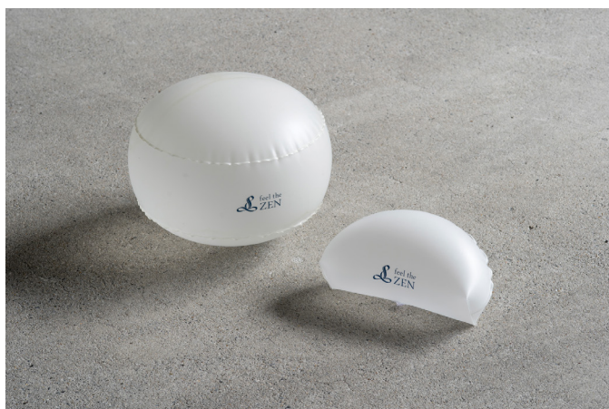
携帯用の空気を入れるタイプのエアザフ