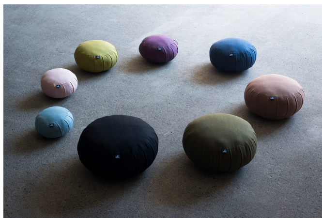
麻のZAFU、6寸から1尺3寸までの8サイズ