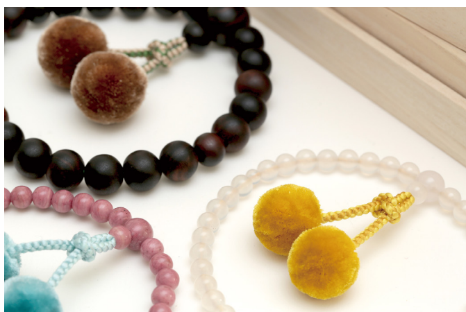
オリジナルの京念珠