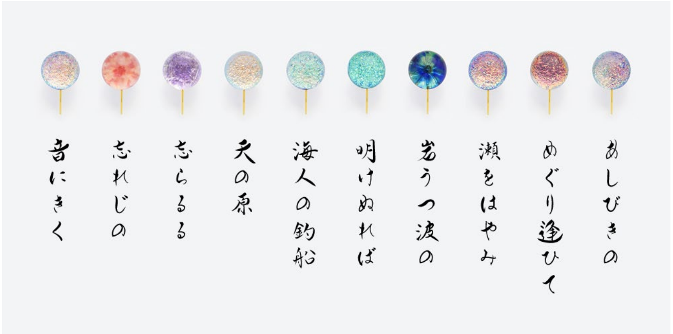
復刻投票により選ばれた 10 首