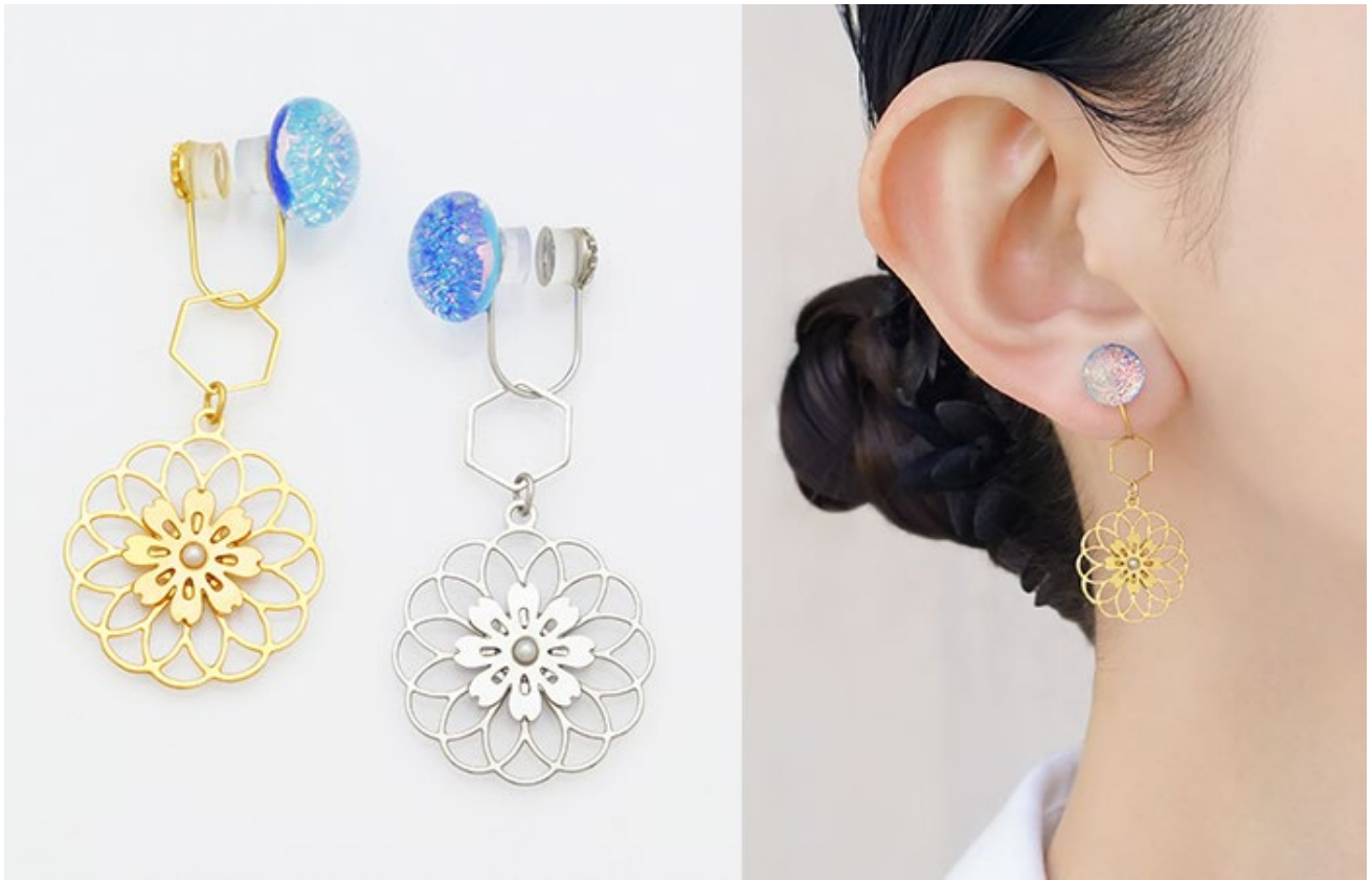
限定カスタマイズチェーン「矢車草」