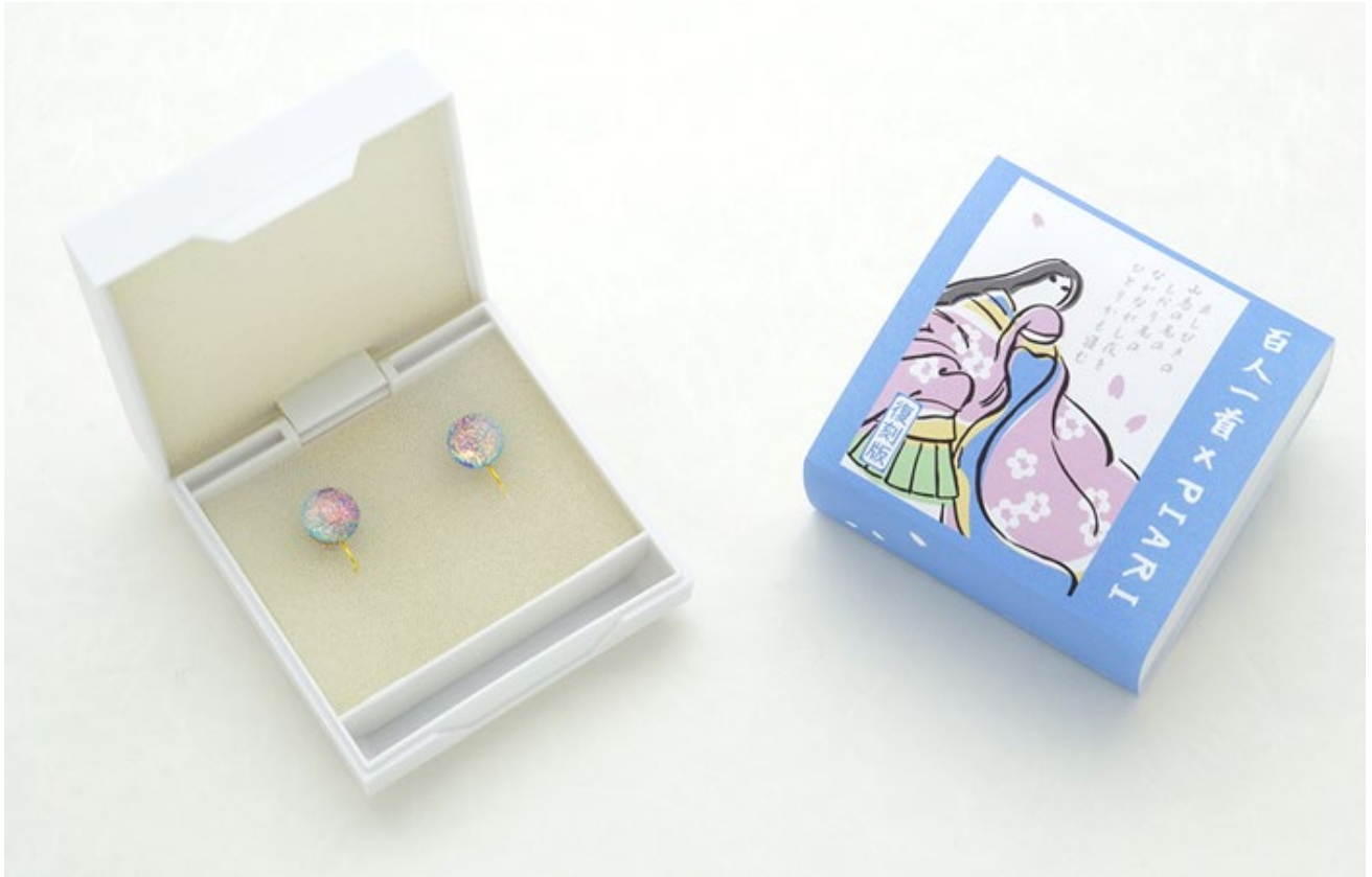
百人一首シリーズ限定パッケージ