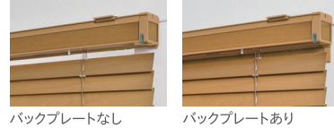
バックプレートなし