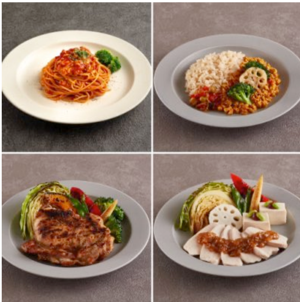
提供される弁当のイメージ

創業8周年スペシャルキャンペーンにより、期間内にお申し込みいただいた全ての方に「ダイエットに理想的なバランスのお弁当」を無料でプレゼントいたします。