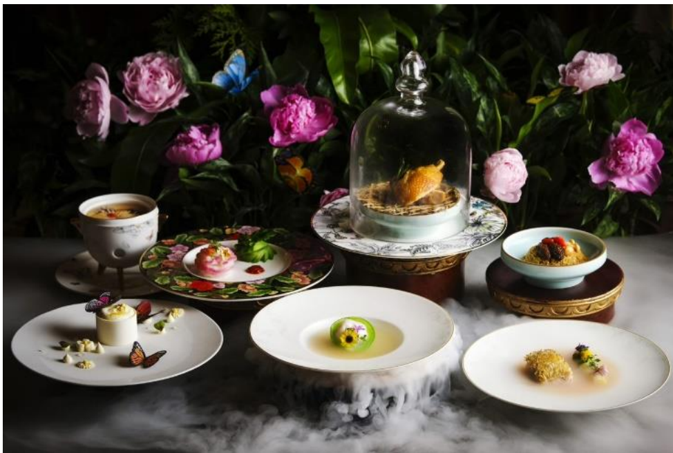
アイランド シャングリ・ラ 香港「サマーパレス」限定：6 コーステイastingメニュー “The Epicure's Shangri-La”

シャングリ・ラは、美食家のゲストのために、中華料理やアジア各地の料理からインスピレーションを得た Find Your Shangri-La メニューをご用意しています。ホテルごとに特別なメニューをご用意しており、どのメニューも想像を超える味わいと演出を凝らし、ゲストに喜びの瞬間をお届けいたします。Find Your Shangri-La メニューは 2023 年 8 月 13 日まで提供いたします。