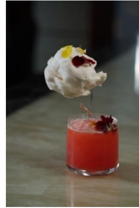
#FindYourShangriLa カクテル：（左から） デイドリーマー、テイスト オブ エデン、スカイ イズ ザ リミット

また、Find Your Shangri-La キャンペーンのテーマからインスピレーションを得た、幻想的なカクテルとモクテルのコレクションをご用意しております。2023 年 12 月 31 日までご利用いただける #FindYourShangriLa のカクテルは「デイドリーマー」、「テイスト オブ エデン」、「スカイ イズ ザ リミット」の 3 種類で、ブランドフィルムのテーマソング「虹の彼方に」を聴きながら堪能いただけます。シャングリ・ラのメンバーシッププラットフォームであるシャングリ・ラ サークルの会員は、毎月 6 日のメンバーズデーに #FindYourShangriLa カクテルを無料でお楽しみいただけます。