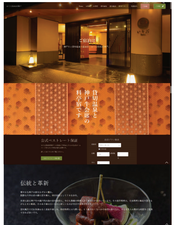
テンプレートを使用して制作されたサイト

このテンプレートの特徴は、宿泊施設専用に開発 されていることです。汎用的なテンプレートは既に 世の中に存在しますが、宿泊施設において使用するには 機能が十分とは言えませんでした。というのも宿泊施設の ホームページでは予約システムへの導線を充実させる ことが重要なためです。