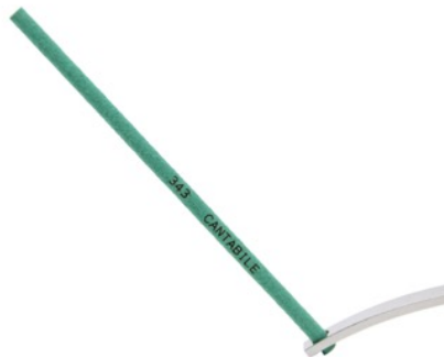
インセンスイメージ