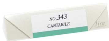
10本入りパッケージイメージ