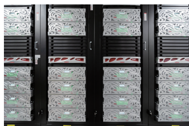
導入システム ES400NVX 13台

東北大学 東北メディカル・メガバンク機構 (ToMMo) は、2012年2月に、未来型医療を築いて東日本大震災の復興に取り組むために設置され、被災地の地域医療再建と健康支援に取り組みながら、医療情報とゲノム情報を複合させたバイオバンクを構築している。その要となるのが、スーパーコンピュータシステムである。東北メディカル・メガバンク機構が運用するスーパーコンピュータシステムは、2014年7月にPhase 1システムの本格運用が開始され、2018年に第2世代となるPhase 2システムに更新された。