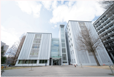
東北大学 東北メディカル・メガバンク機構 (ToMMo)