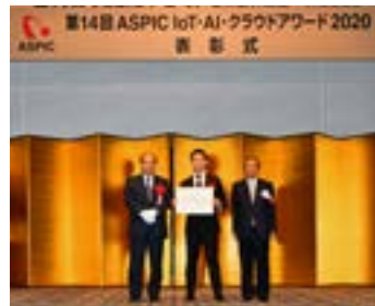
アワード2020(第14回) 谷脇康彦 総務審議官より授与