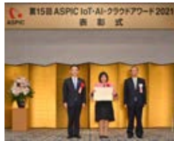
アワード2021(第15回) 中西祐介 総務副大臣より授与