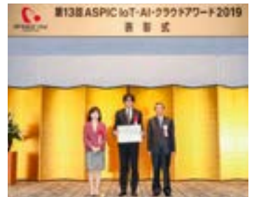
アワード2019(第13回) 木村弥生総務大臣政務官より授与