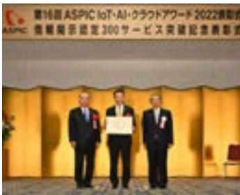
アワード2022(第16回) 柘植芳文 総務副大臣より授与