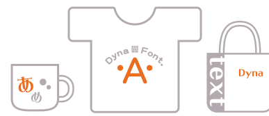
オリジナルグッズなどの新規サービス

Webブラウザやクライアント上で動作するアプリケーションからネットワークを通じてサーバーを通信し、サーバー内のアプリケーションが処理してクライアントに生成物を出力するサービスが該当します。Flashファイルなどにフォントデータをフルセット埋め込んで配信することも可能です。