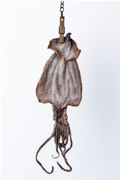
前原冬樹 《『一刻』スルメに茶碗》(部分) 2022年 木彫

開催趣旨：2019年に当館で開催し、多くの観客を魅了した「驚異の超絶技巧！明治工芸から現代アートへ」。本展はそれをさらに発展させ、明治工芸のDNAを継承しつつ多様な素材と技法を駆使して、新たな領域に挑む現代作家の新作を中心に紹介します。進化し続ける作家たちが繰り出す驚きと感動の超絶技巧を、明治工芸の逸品とあわせて、今回もぜひご体感ください。