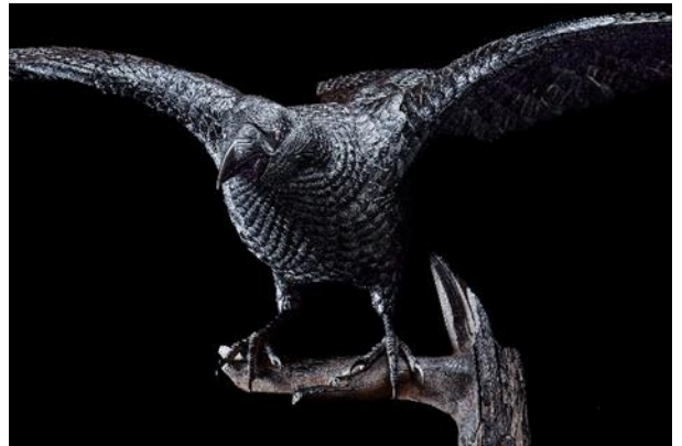
本郷真也 《Visible01 境界》(部分) 2021年 金工