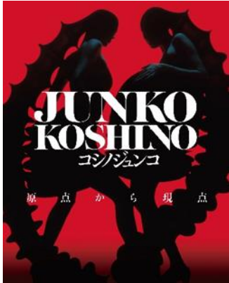
「コシノジュンコ 原点から現点」メインビジュアル

開催趣旨：大阪・岸和田に生まれたコシノジュンコは、1960年に新人デザイナーの登竜門とされる装苑賞を最年少の19歳で受賞、以後東京を拠点にファッションデザイナーとしての活動をスタートさせます。世界各地でショーを開催し高い評価を得る一方、近年では服飾デザインの領域を超えた新たな境地を切り開いています。本展は、常にモードの先端を走り新たな創造を繰り返すコシノジュンコの活動の全貌を紹介する過去最大規模の展覧会です。衣装やデザイン画、写真パネルなど約200点からその魅力に迫ります。