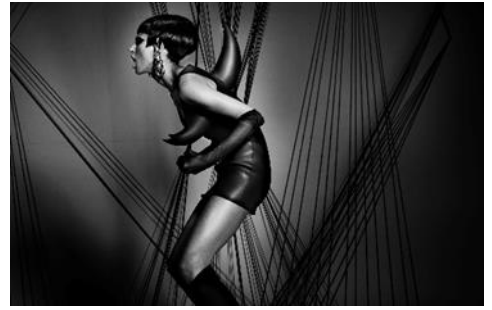
SPIKE DRESS 2010年