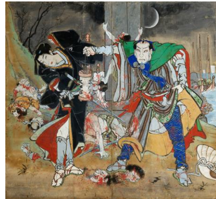
浮世柄比翼稲妻 鈴ヶ森 (高知県指定文化財) 二曲一隻屏風・紙本彩色 香南市赤岡町本町一区 ※前期展示(4/22～5/21)