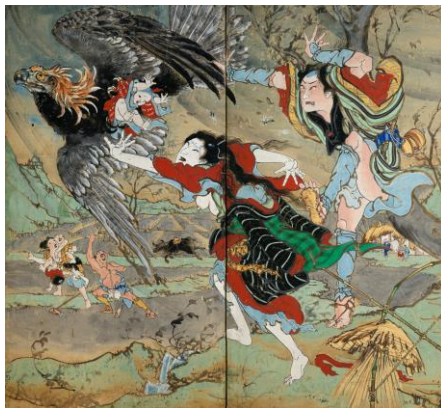
花衣いろは縁起 鶯 (高知県指定文化財) 二曲一隻屏風・紙本彩色 香南市赤岡町本町二区 ※後期展示(5/23～6/18)