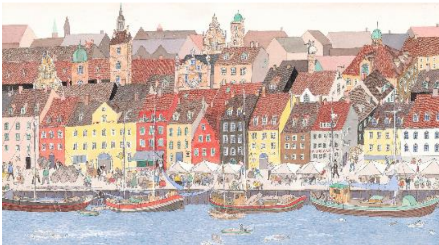
《旅の絵本VI デンマーク編》 2004年 津和野町立安野光雅美術館蔵©空想工房

開催趣旨：島根県津和野町に生まれた安野光雅（1926—2020）は、半世紀以上にわたり画家、絵本作家、装丁家として多彩な活躍を続けました。その独創的な作品は国内外の高い人気を得ています。本展では、絵本のデビュー作『ふしぎなえ』から、近年の大作『繪本 三國志』まで、やさしく、美しく、ユーモアと不思議にあふれた安野ワールドを紹介します。