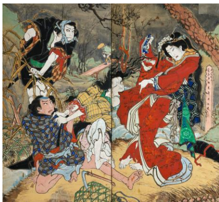
伊達競阿国戯場 累 (高知県指定文化財) 二曲一隻屏風・紙本彩色 香南市赤岡町本町二区 ※後期展示(5/23～6/18)

本展は、高知県外では約50年ぶりの大規模展です。幕末の土佐に生き、異彩を放つ屏風絵・絵馬提灯などを残した「絵金」の類稀なる個性と、その魅力について、代表作をはじめ約100点の作品により紹介します。